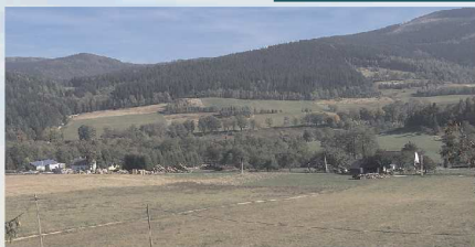
Stara Morawa- panorama

Nazwa wsi pochodzi od potoku Morawy, obecnie Morawki. Historia powstania wsi jako osady leśnej, wiąże się najprawdopodobniej z działalnością kuznicy (huty żelaza) od 1588 r. Już w XVII w. prowadzono tam też przetwórstwo miedzi. Po upadku kuznicy mieszkańcy Starej Morawy zajmowali się rzemiosłem. W 1840 r. zbudowano na Morawce, na północ od Starej Morawy zapórę wodną.