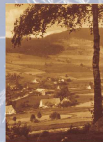
Stary Gieraltów ok. 1925 roku

Stary Gieraltów jest doskonałym miejscem rozpoczęcia pieszych, bądź rowerowych wyprawek w Góry Białskie oraz Góry Żłote.