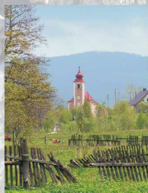
Kościół Św. Michała Archanioła

We wsi znajduje się późnobarokowy kościół filialny św. Michała Archanioła z 1798 r. z barokowym wyposażeniem. We wsi stoi barokowa kapliczka przydrożna z II połowy XVIII w., a także stare chaty sudetów z przełomu XVIII/XIX w.