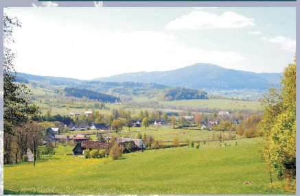
Stary Gieraltów w dolinie Białej Łądeckiej

Łatwa zabudowana wieś położona nad rzeką Białą Łądecką. Pierwsze wzmianki pochodzą z r. 1346. Mieszkańcy wsi początkowo zajmowali się rolnictwem, ale rozwijał się tu również przemysł, związany z pozyskiwaniem i obróbką drewna z okolicznych lasów.