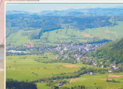
Dolina - Stronie Śląskie